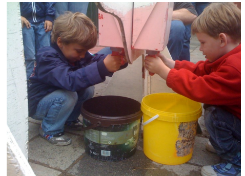
Groep 1 bij de kaasmakerij